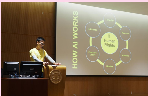
分享嘉賓 ● 國際特赦組織